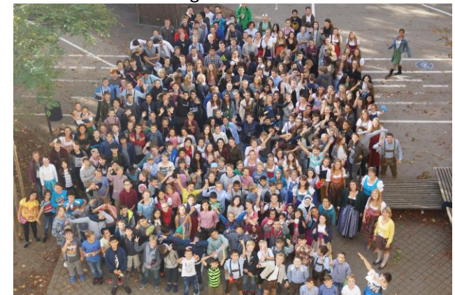
Tag der Tracht