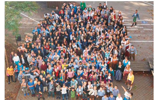
Tag der Tracht